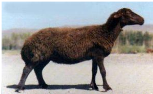
شکل ۶- گوسفند قزل

گوسفندان نژاد شیری دارای تولید شیر بیشتری نسبت به سایر نژادها هستند و اغلب دارای لگنی عریض و پهن و بدنی ظریف هستند. در این دام‌ها، پستان‌ها پرشیر و شکلی کاملاً قرینه دارند. مهمترین نژاد شیری ایران نژاد قزل است. وزن تولد و وزن شیرگیری در بره‌های نر به ترتیب ۴/۶۳، ۲۳/۳ و ماده این نژاد به ترتیب ۴/۲۵، ۲۱/۹ کیلوگرم می‌باشد. ضمن اینکه درصد دوقلو زایی و درصد باروری در نژاد قزل به ترتیب ۱۱ و ۹۴ درصد گزارش شده است.