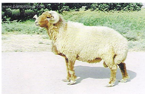
شکل ۱- گوسفند عربی

از نظر پراکندگی، گوسفند نژاد عربی بومی حاشیه غربی و جنوبی استان خوزستان است. جمعیت این دام اهلی حدود ۴۰۰۰۰۰ راس است. رنگ بدن این نژاد سفید است ولی به رنگ‌های قهوه‌ای، سیاه و خاکستری نیز مشاهده می‌شود. دنبه، کوتاه و به شکل نیم دایره بوده و دنبالچه‌ی باریک و بلندی نیز بر روی آن وجود دارد. اندازه دنبه نسبت به سایر نژادها کوچکتر است و وزن آن ۳ تا ۵ کیلوگرم می‌باشد. قد کوتاه و بدن نسبتاً طویل و عضلانی است. لذا برای پرواربندی مناسب می‌باشد. در این نژاد، قوچ‌ها دارای شاخ ولی میش‌ها بدون شاخ هستند.