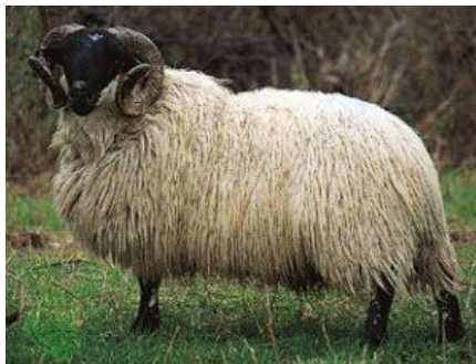
شکل ۴- گوسفند شال

گوسفند شال که بومی منطقه بوئین زهرای استان قزوین است این نژاد سرعت رشد بالایی دارد و از نظر تولید شیر نیز از توانایی کمی و کیفی خوبی برخوردار است. درصد وزن لاشه سرد به وزن زنده در بره‌های پرواری این نژاد ۴۹/۹۹ درصد و وزن چربی لاشه به وزن زنده حدود ۱۳/۴۶ درصد است. همچنین مقدار تولید پشم سالیانه قوچ یک الی ۱/۳ کیلوگرم و میزان میش سالیانه ۰/۸ تا یک کیلوگرم است.