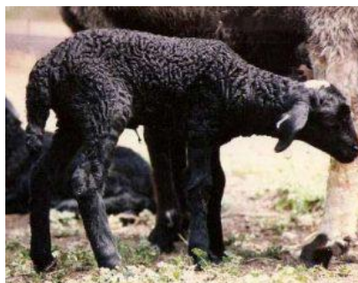
شکل ۵- گوسفند قره گل

گوسفندان این نژاد پوستی نرم و لطیف داشته و دارای پشم‌هایی مجعد و ظریف هستند. پشم این گوسفندان به دلیل نرم بودن تارهایش برای تولید پالتو و کلاه و ... استفاده می‌شود. نژاد پوستی دارای دست و پای کشیده، باریک و ظریف است و پشمهایی دارای رنگ خاص با تارنازک و بلند اما کم پشت دارد و بره‌های جوان تر این نژاد پوست مرغوب تری دارند. میانگین وزن تولد در این نژاد ۳ کیلوگرم می‌باشد.