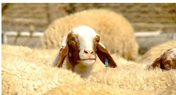
شکل ۳- گوسفند سنجابی

گوسفند سنجابی که نام آن از ایل سنجابی (یکی از ایلات استان کرمانشاه) گرفته شده است، بیش از ۵۰ درصد جمعیت گوسفند استان را در بر میگیرد. این نژاد بعد از گوسفند بلوچی دارای بیشترین جمعیت در بین گوسفندان ایران بوده و در اکثر نقاط استان شامل اسلام آباد غرب، گیلانغرب، سرپل ذهاب و قصر شیرین پراکنده است. گوسفند سنجابی نژادی دنبه دار با جثه ای بزرگ و دست و پایی بلند است. صورت آن قهوه ای تا قهوه ای کمرنگ و بدن آن پشمی بلند، نسبتاً سفید و ضخیم پوشیده شده است. از لحاظ تولید جزء گوسفندان گوشتی و گوشتی- پشمی بوده، دارای تولید شیر مناسب، مقاوم نسبت به شرایط محیطی و سرعت رشد و کیفیت پشم مناسبی دارد. میانگین وزن تولد بره ها ۴/۵ و میانگین وزن پشم ۲/۵ کیلوگرم می باشد.