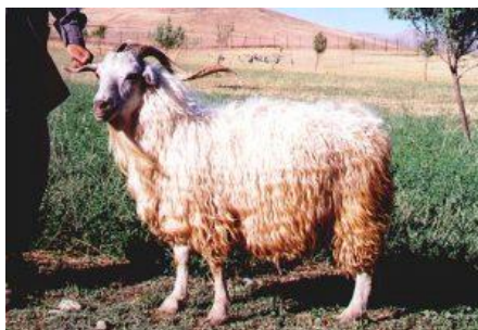
شکل ۳- بز نژاد تالی