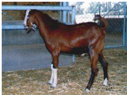
شکل ۱- بز نژاد نجدی