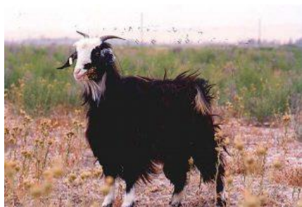
شکل ۵- بز نژاد خلخالی

عمده پراکنش بز نژاد خلخالی در دشت مغان و شهرستان خلخال و بخش هایی از استان آذربایجان شرقی قرار دارد. بزهای این نژاد به رنگ سیاه و دارای بدنی پوشیده از موهای بلند و ضخیم است. طول دوره شیردهی این نژاد ۱۳۰ روز و دارای وزن بلوغ معادل ۴۰ کیلوگرم می باشد.