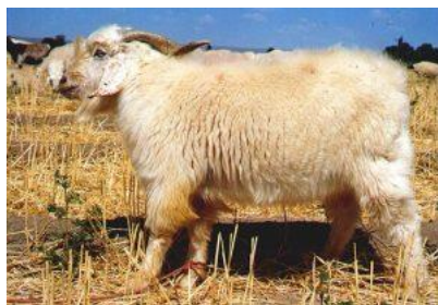
شکل ۴- بز نژاد کرکی رائینی