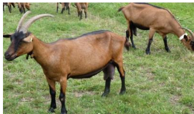
شکل ۷- بز نژاد عدنی

بزهای این نژاد تولید شیر نسبتاً مناسبی دارند. غالباً به رنگ آهویی و بندرت به رنگ‌های حنایی، ابلق سفید و قهوه‌ای، سفید، ابلق سیاه و سفید، سیاه دیده می‌شوند. این نژاد بومی استان بوشهر و دارای میانگین وزن بزهای نر و ماده به ترتیب ۳۶ و ۲۵ کیلوگرم می‌باشد. میانگین تولید شیر در یک دوره شیردهی از ۱۲۰ تا ۱۸۰ لیتر در سال متغیر بوده و میانگین تولید شیر روزانه هر بز عدنی ۱/۵ لیتر و رکورد آن ۳/۵ لیتر است.