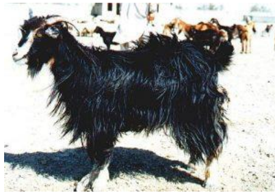
شکل ۶- بز نژاد سیستان بلوچستان